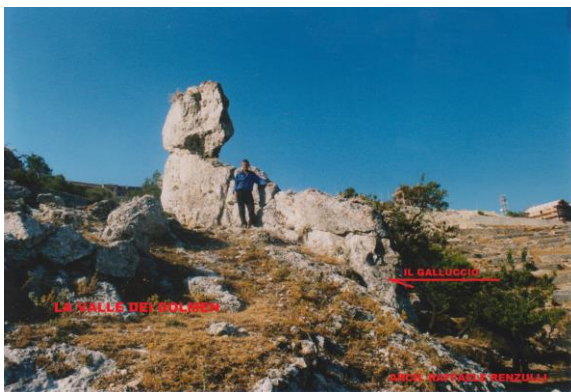
Disco del “Galluccio”

BOLLETTINO UFFICIALE DELLA REGIONE PUGLIA n.9 DEL 21/01/2020