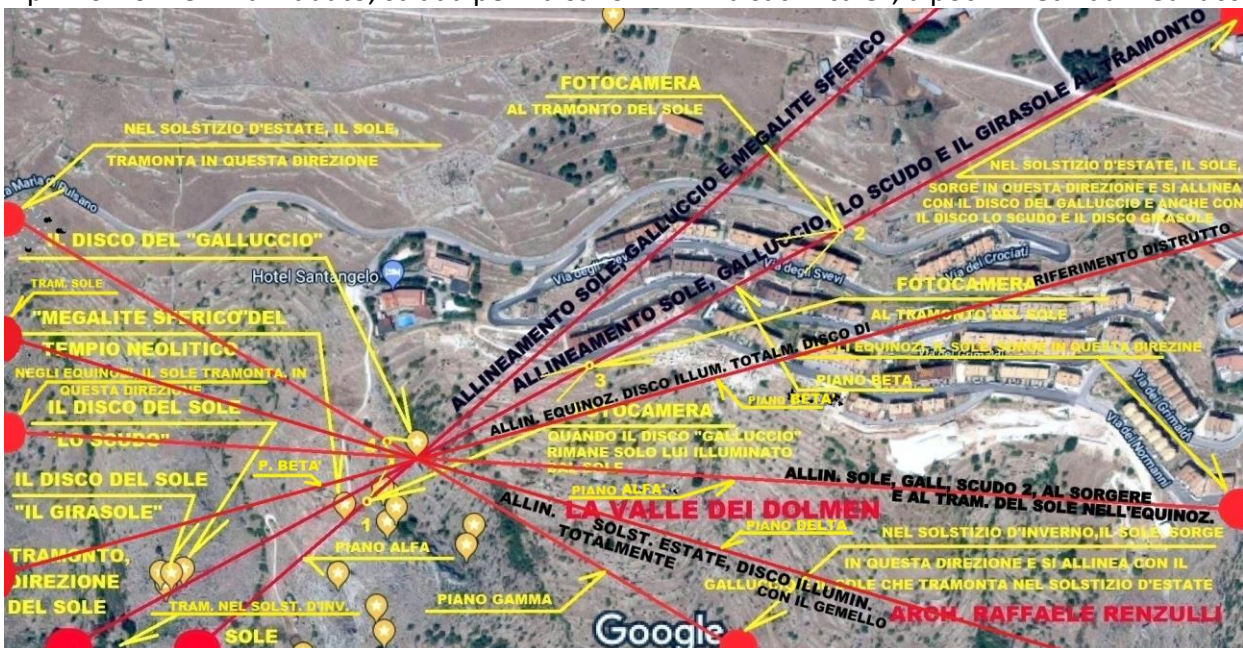
Foto satellitare: Qui sono posizionati tutti gli allineamenti nei solstizi e negli equinozi. E' da notare, come il disco del "Galluccio" sia il punto focale di tutti gli allineamenti 28/01/2020 Arch. Raffaele Renzulli