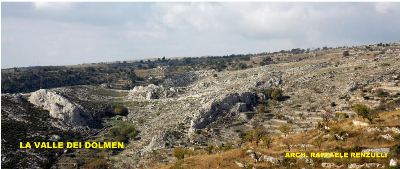
Veduta panoramica de “La Valle dei Dolmen” - Monte Sant’Angelo (FG) -