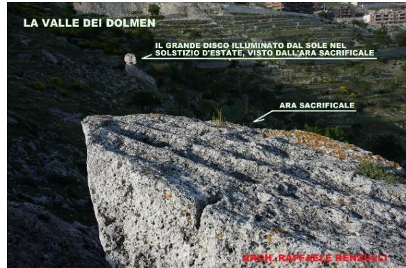
Il primo Dolmen individuato, strada per Pulsano "Ara sacrificale", a pochi metri dal "Galluccio"