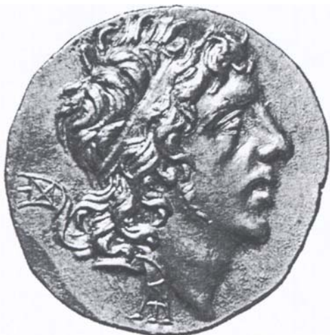
Fig. 2. Al recto il ritratto del sovrano volto a destra.