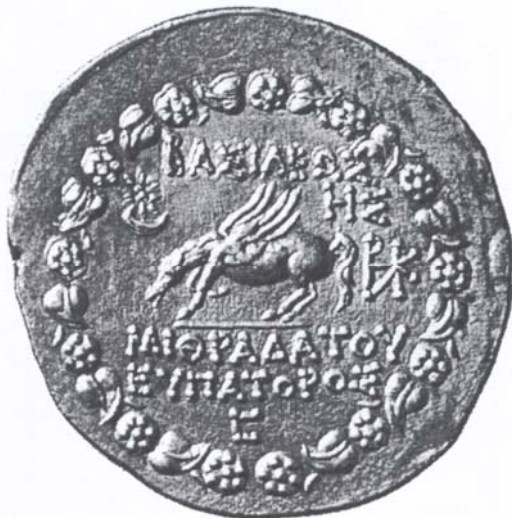
Fig. 3. Al verso: scritta così tradotta: BASILEUS (= re) MITRIDATE EUPATORE (=di nobile padre, Zingarelli; di nobile nascita, Rocci); monogramma; figura di Pegaso inchinato volto a sinistra; qui una stella sopra crescente lunare. Il tutto è all'interno di una corona di fiori e frutti.